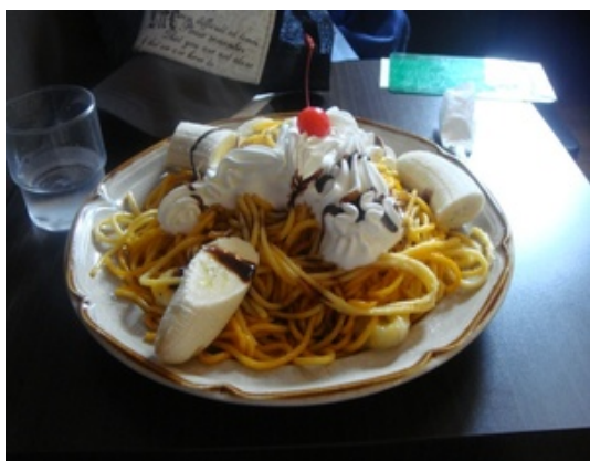
甘口バナナスパゲティ(お、おいしかったです。)

店名から登山用語になぞらえて、喫茶マウンテンへ向かうことを「登山」、完食したときは「登頂」、一人で食べきった場合は「単独登頂」と呼ばれる。さらに、注文したものを残してしまった場合は「途中下山」と呼ばれ、無理な食べ過ぎ等により気分が悪くなったりしてしまった場合は「遭難」と呼ばれる。