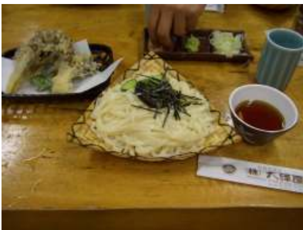
日本3大うどんの水沢うどん。まいたけの天ぷらがうまい。