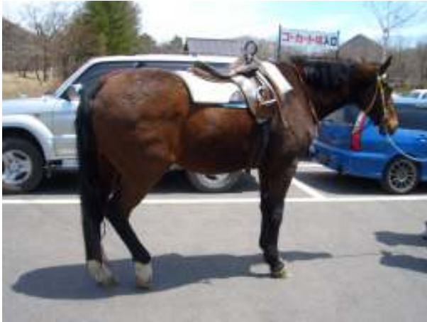
榛名富士の付近には馬がいっぱい。